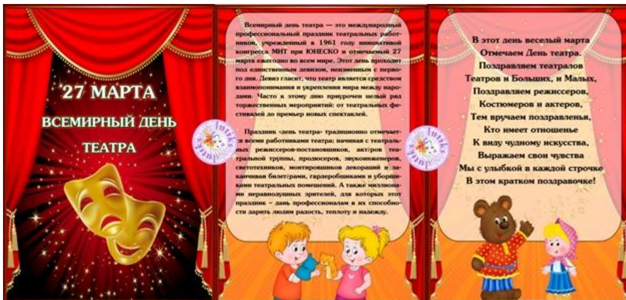
Театрализованная деятельность. Кружок «Колобок» во второй младшей группе