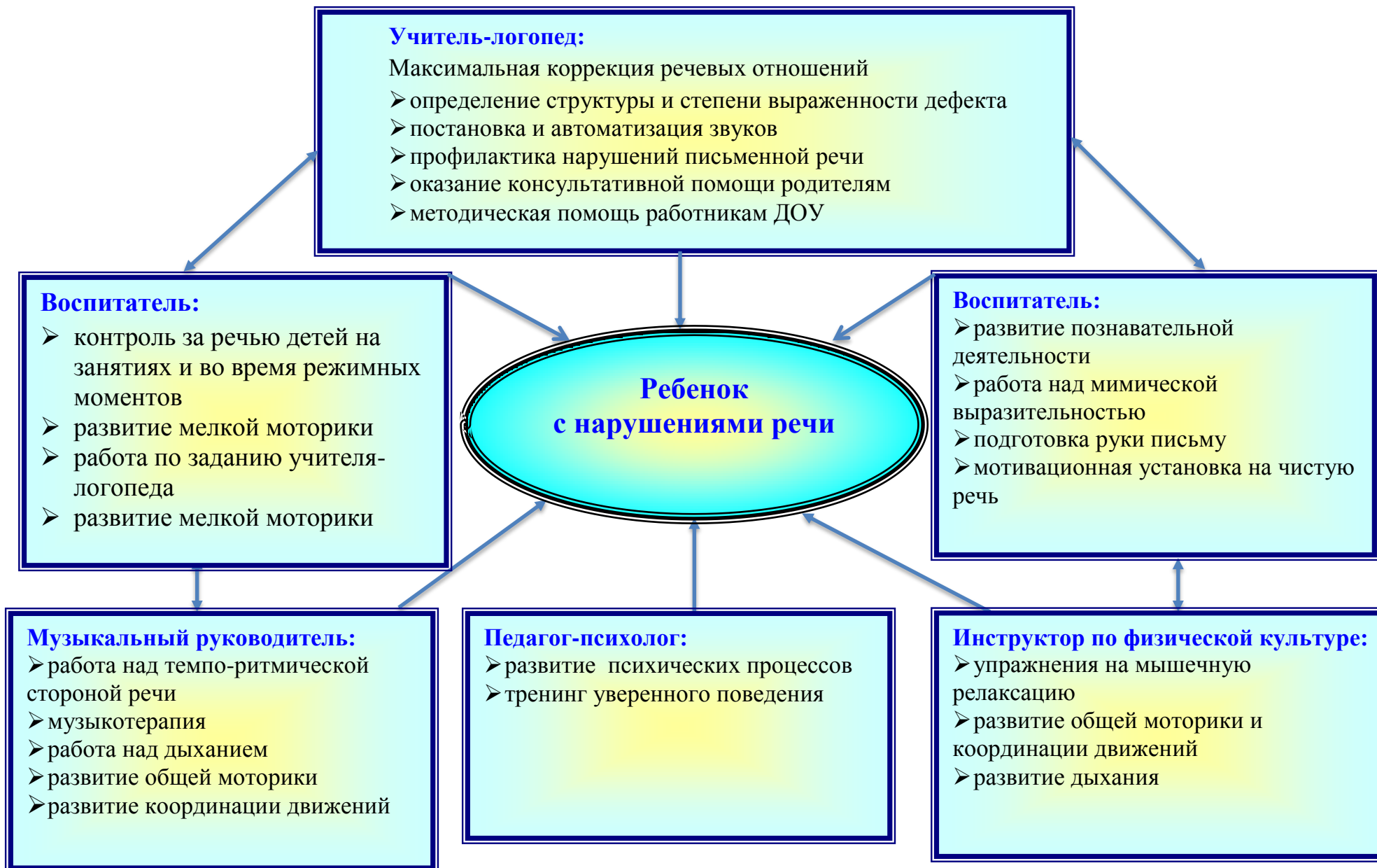
Схема взаимодействия участников коррекционного процесса