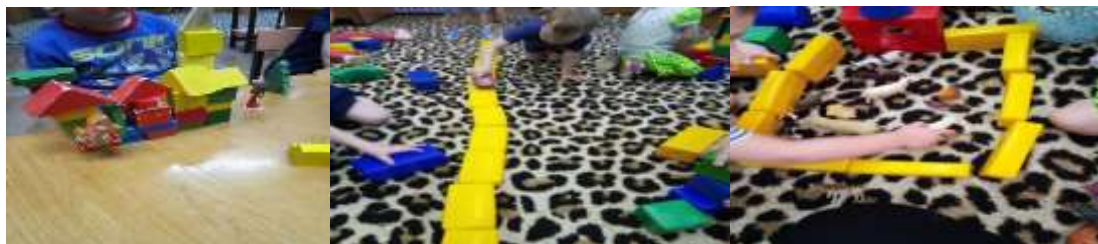
«Ворота для грузовичка»

«Дорога для Машины» «Загон для домашних животных»